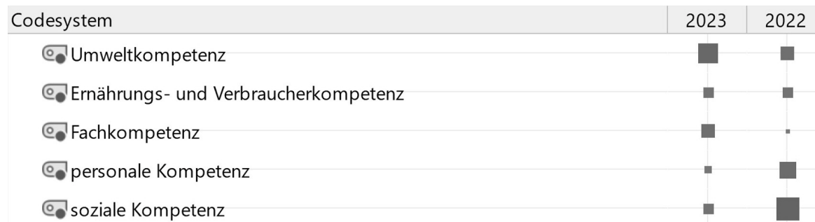
Abb. 2: Code-Matrix-Browser zur visuellen Darstellung der Einschätzung der Kompetenzentwicklungsbereiche bei Grundschulkindern (Größe der Kästchen korrespondiert mit Häufigkeit der Nennungen)

An dieser Stelle bleibt jedoch offen, ob und wie diese Motivation auch innerhalb der zweiten oder dritten Phase beibehalten wird bzw. werden kann. Um den Fortbestand des Schulgartenunterrichts in Sachsen zu sichern, müssen neben der Verankerung im Stu- dium zukünftig auch Fortbildungen für bereits im Schuldienst aktive Lehrkräfte etabliert werden. Da- neben gilt es, Konzepte auszuarbeiten, die traditio- nelle Schulgartenarbeit und BNE zusammenführen.